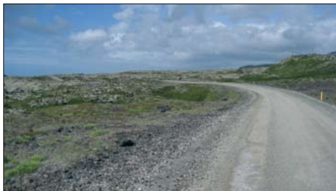
Útboði á endurgerð Útnesvegur um þjóðgarð hefur verið frestað vegna breytinga á umfangi verks.