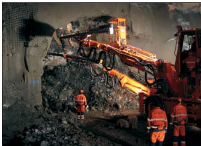
Héðinsfjarðargöng. Gangagerð í Ólafsfirði. Einnig mynd á forsíðu.