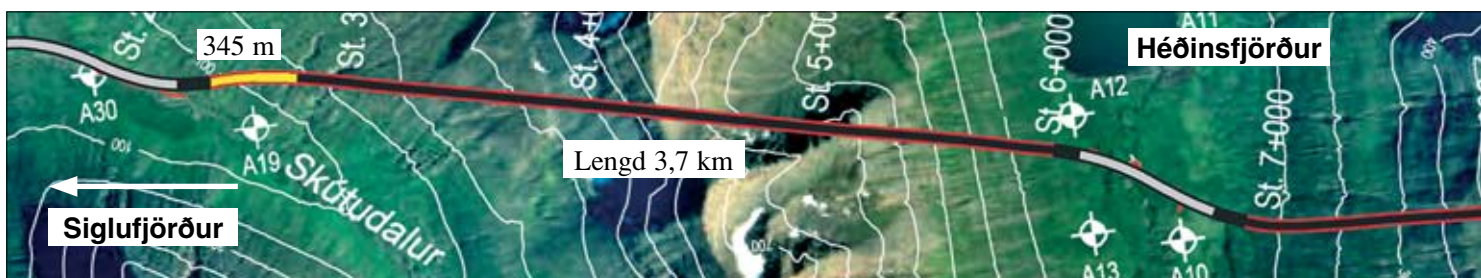
Staða framkvæmda við Héðinsfjarðargöng 13. nóvember 2006. Búið er að sprengja 345 m í Siglufirði og 41 m í Ólafsfirði.