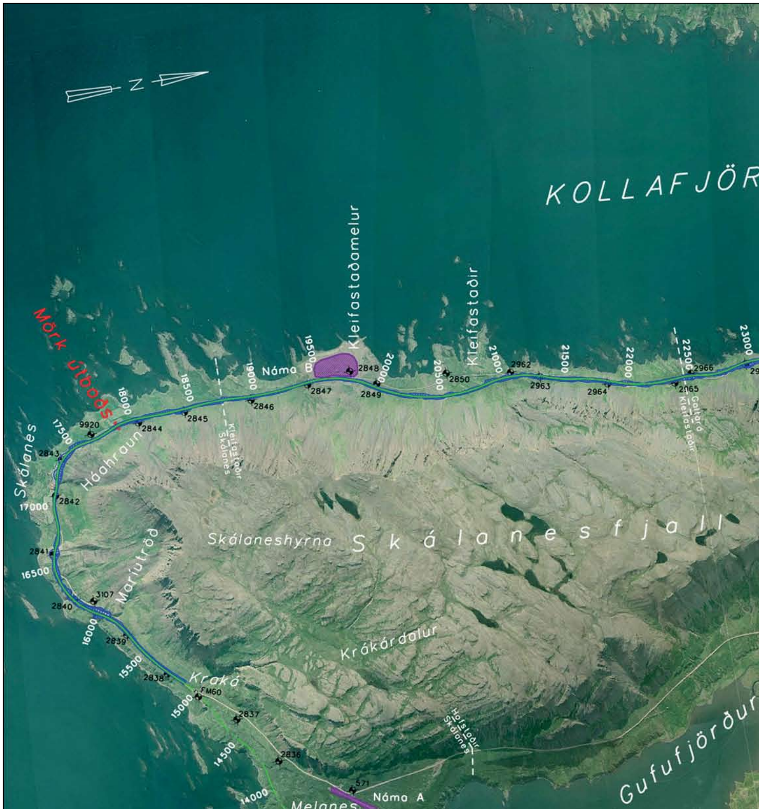
Vestfjarðavegur (60), Skálanes - Eyri. Útboð vegagerðar á þessum kafla var auglýst í síðasta tölublaði og er auglýsingin birt að nýju í þessu tölublaði vegna prentvillu. Loftmyndin sýnir útboðskaflann í Kollafirði. Kortið sýnir staðsetningu kaflans.